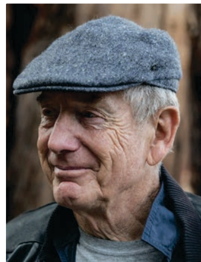
Gilles Clément

Parmi ses réalisations majeures figurent Le Jardin des Méditerranées au Domaine du Rayol (auquel il est particulièrement attaché et dont il continue de suivre l'évolution à travers deux comités techniques annuels avec l'équipe des jardiniers du Domaine) les jardins de l'Abbaye de Valloires, le jardin de l'ENS de Lyon et, en région parisienne, les jardins du Musée du Quai Branly et de l'Arche de la Défense, le Parc André-Citroën.