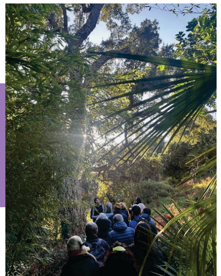
La visite du jardinier

Des activités pour enfants sont également proposées durant les vacances scolaires pour satisfaire les plus jeunes (dès 6 ans) : l'activité « Les mains dans la terre », afin de mieux comprendre le cycle de vie des plantes et du sol, et « Les petites bêtes du jardin », pour porter un nouveau regard sur les insectes.