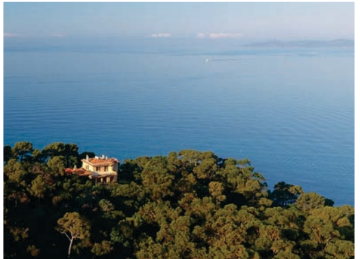
La Villa Rayolet

La Fondation Gecina est intervenue pour la réhabilitation de la Villa Rayolet et de ses abords (notamment la création du sentier botanique) et a contribué à l'aménagement de l'accessibilité du Domaine du Rayol pour les personnes à mobilité réduite, au côté de la Fondation Crédit Agricole Pays de France, de la Fondation d'entreprise Crédit Agricole Provence Côte d'Azur (intervenue aussi pour la construction de la serre) et d'autres mécènes.