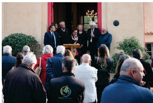
Restauration de la Villa Rayolet

Via le Conservatoire du littoral, Le Petit Marseillais a apporté son soutien pour la création du sentier botanique, et Colam Initiatives pour la restauration des façades de l'Hôtel de la Mer. Cette restauration majeure de l'Hôtel de la Mer (1,7 M€) a été rendue possible en 2022-2023 grâce au plan de relance de l'État.