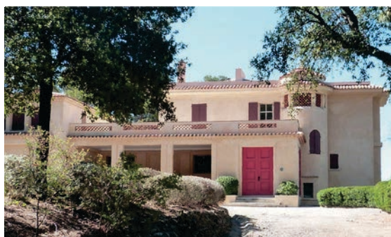
La Villa Rayolet

Construite en 1925 par les Courmes, puis agrandie et modernisée au début des années 1940 pour la famille Potez, la Villa Rayolet est aujourd'hui inscrite à l'Inventaire supplémentaire des monuments historiques. Cette villa bourgeoise et balnéaire qui fait écho au nouveau mode de vie de l'après-guerre se visite désormais tous les jours. Elle accueille une exposition permanente « De la villégiature au Jardin des Méditerranées de Gilles Clément » .