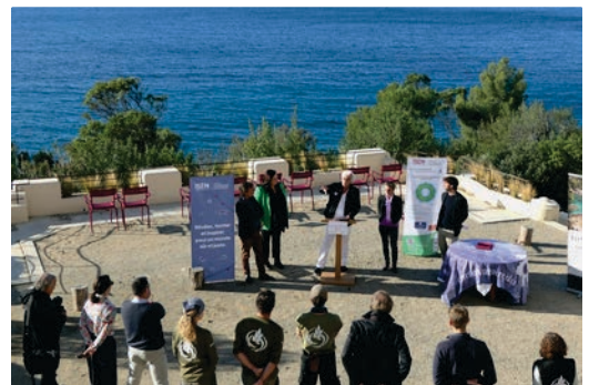
Signature de la convention entre l'ISEN et le Domaine du Rayol

Enfin, France Bleu Provence est partenaire média du Domaine du Rayol.