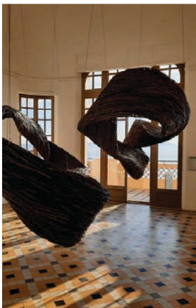
Sans retour