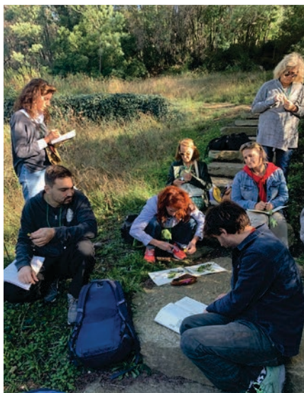
Formation Perfectionnement à la Botanique

Pour les groupes scolaires, des activités pédagogiques adaptées à chaque niveau sont également proposées. L'été, le 11e paysage, le Jardin marin se découvre soit en combinaison, palmes, masque et tuba (adultes et enfants dès 8 ans), soit à partir de 4 ans, grâce à l'activité « Les pieds dans l'eau » (sur inscription).