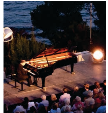
29e Festival