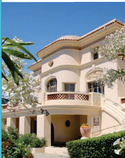
L'Hôtel de la Mer

La Librairie et la Pépinière sont accessibles indépendamment de l'entrée au Jardin.