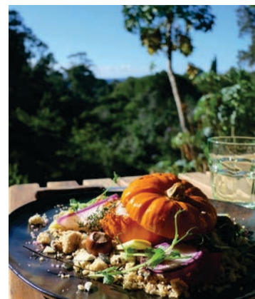
Le Café des Jardiniers

Au cœur du Jardin, le restaurant Le Café des Jardiniers saura séduire vos papilles. En résonance avec le concept du Jardin, le Café vous propose pour le déjeuner une cuisine créative, de saison, inspirée des jardins de Méditerranée et d'ailleurs, et une agréable pause gourmande dans l'après-midi. Dans une démarche éco-responsable, cohérente avec les principes de gestion du Domaine du Rayol, le chef travaille avec des produits frais, de saison et privilégie les circuits courts. Empreint d'originalité, le lieu choisi pour accueillir cet espace détente est au cœur du Jardin, à l'ancienne Ferme.