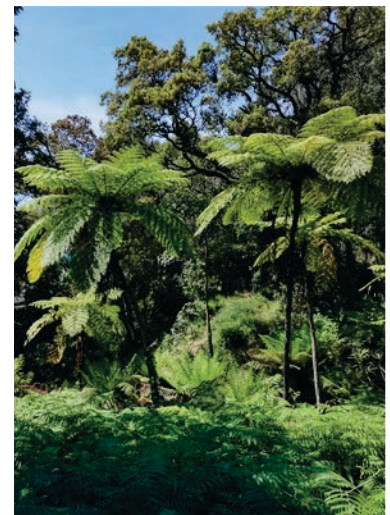
Le Jardin de Nouvelle-Zélande

L'évocation du mouvement, du brassage, de l'évolution des espèces et des paysages, de la transition, de la transformation (des végétaux - le monde vivant -, de la matière - la terre -, de l'esprit - le ciel) illustre les choix de gestion du Domaine du Rayol. Ainsi, jusqu'au jardin marin, inspiré de ce qui est fait à terre et prolongé en mer, le Domaine du Rayol est devenu au fil des années un lieu de référence, naturel et culturel, pour la conservation et la gestion des jardins et paysages méditerranéens.