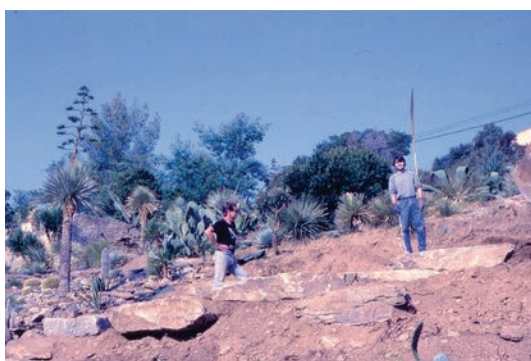
Gilles Clément et un jardinier, 1992

En achetant le Domaine du Rayol en 1989, le Conservatoire du littoral souhaite préserver les richesses naturelles de cette côte varoise, nommée Corniche des Maures, où, caché derrière un rideau de végétation méditerranéenne, se trouve ce paradis exotique.