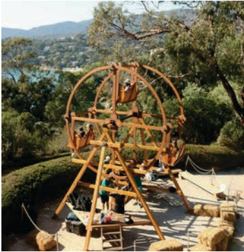
Gondwana © Domaine du Rayol, Nicolas Mouny

En 2025, plus de 10 événements seront proposés dans le cadre des célébrations des 50 ans du Conservatoire du littoral. Le Domaine du Rayol participera également à l'Année de la Mer et prendra part au sommet de l'UNOC en juin.