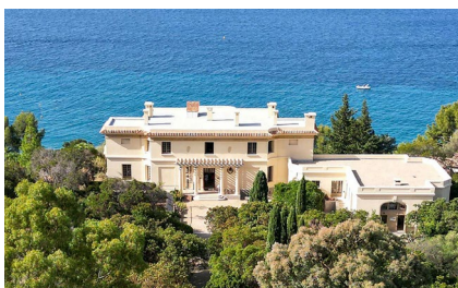
L'Hôtel de la Mer