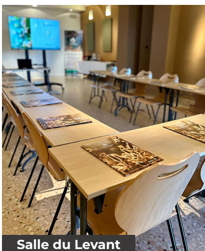
Salle du Levant