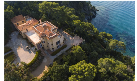
La Villa Rayolet